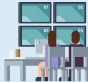
다양한 전자기기가 배치된 상황실