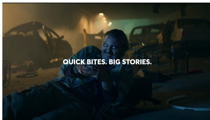
그림 2 Quibi 홍보영상

Quibi는 ‘한 입 꺼리’라는 뜻의 Quick-bites에서 따온 단어로, 숏폼 콘텐츠 중심의 플랫폼 성격을 잘 보여준다. 여타 OTT와는 다르게 10분 내외의 짧은 동영상을 선보일 계획이다. 아래의 이미지는 홍보영상으로, 좀비로 변하기까지 얼마 남지 않은 남자가 그 짧은 시간에 Quibi를 보는 장면이다. ‘QUICK BITES. BIG STORIES.’라는 문구는 짧지만, 고품질의 영상을 제공하겠다는 Quibi의 정체성을 나타내고 있다. Katzenberg는 YouTube와는 다른 성격의 영상을 제공할 것임을 지속적으로 언급하고 있다. CES 2020에서 Whitman은 “우리는 YouTube의 고품질 버전을 만들겠다는 것이 아니다. 오히려 방송과 케이블, TV와 TV 스토리텔링의 생태계를 OTT로 가져오겠다.”고 밝힌 바 있다.