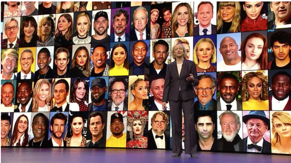
그림 3 Quibi의 제작자 및 출연진

Bill Murray, Kendall Jenner, Tyra Banks, Steph Curry, 50 Cent 등 할리우드 유명 제작자와 배우 등이 연출과 출연을 맡는다. 영향력 있는 인물들을 다수 섭외한 Quibi의 배경에는 저작권 설정 방식이 자리 잡고 있다. Quibi는 콘텐츠의 저작권을 7년간 소유하고 있다가, 그 이후에는 제작자에게 저작권을 넘겨준다. 숏폼이 아닌 30분~2시간 분량의 콘텐츠인 경우에는 2년 후에 라이선스를 돌려준다. 이는 타 OTT 플랫폼과는 다른 행보이다. 제작자에게 이익을 줄 수 있는 계약 조건이 권위 있는 제작자를 섭외하는 유인이 된 것으로 보인다.