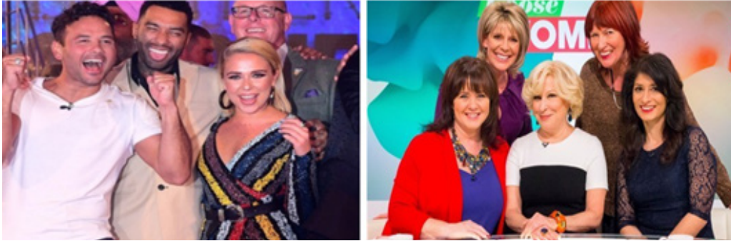
그림 3 (왼쪽) Celebrity Big Brother (오른쪽) Loose Women