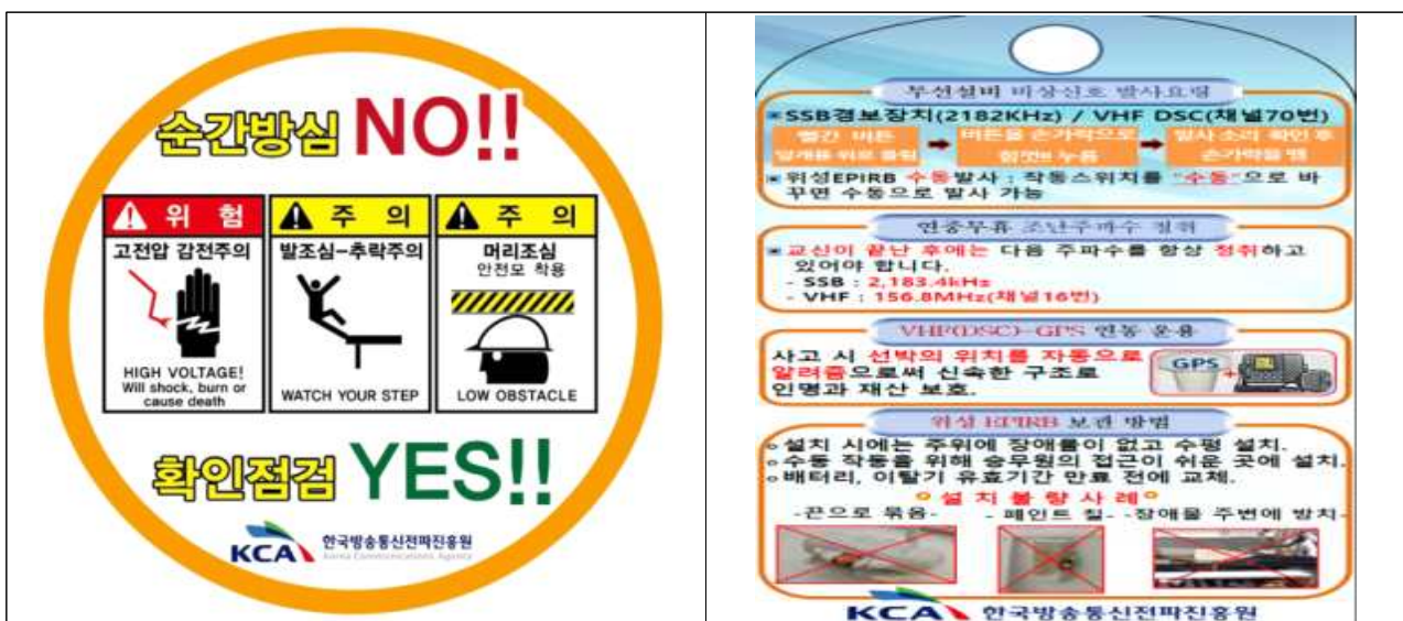
[선박 안전사고 예방 홍보물 사진]