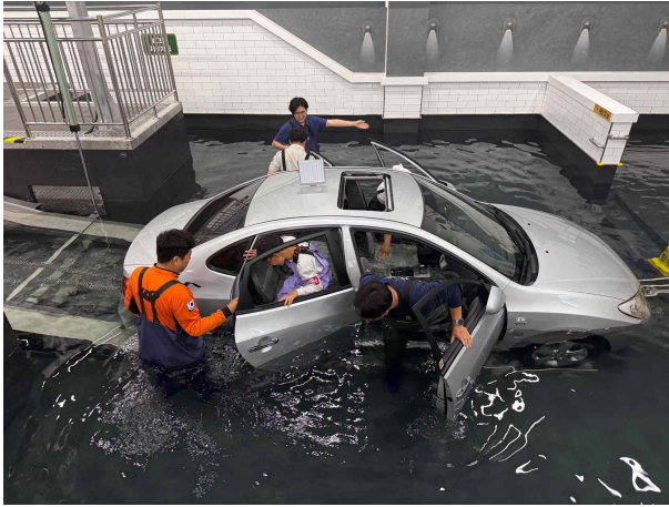
(사진1) '안전을 함께' 재난 시 대체 요령의 체험