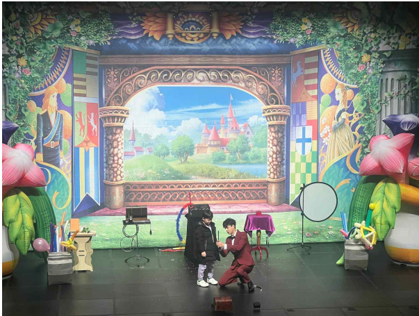
(사진3) '행복을 함께' 마술쇼